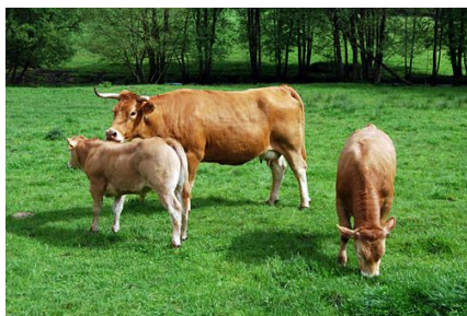
VACUNO RAZA GALLEGA